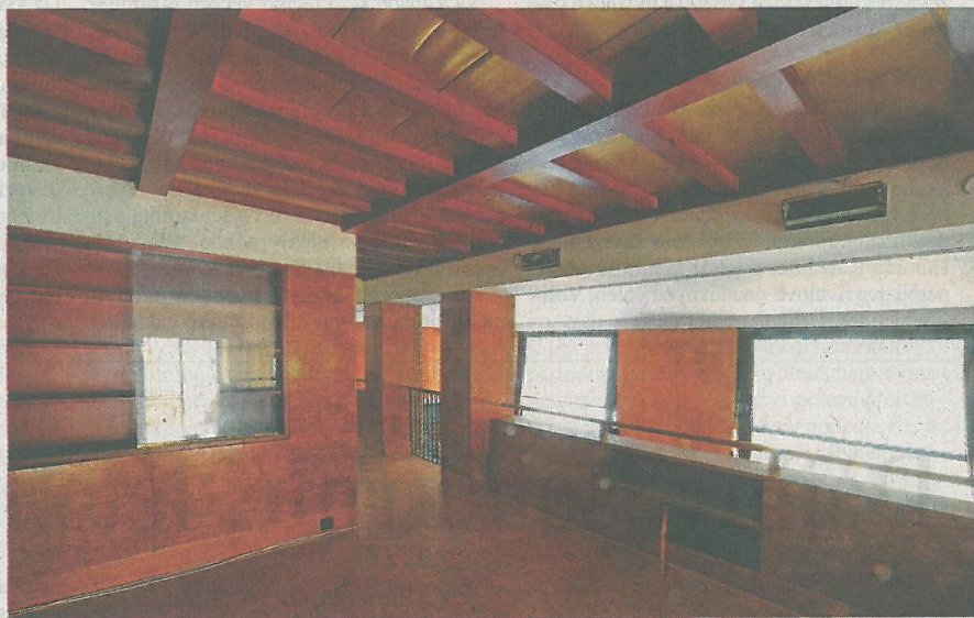
Raumplan v Plzni. Také zde Loos použil svůj vynález, jak uspořádat vnitřní prostor stavby.

s plynulou návazností prostor různých výšek, tedy tzv. loosovský raumplan. „Jako by do bytového objektu vložil vestavbu třípodlažní vily, připomínající dnes slavnou Müllerovu vilu v Praze, kterou Adolf Loos projektoval právě v Plzni jen pár roků předtím se spo-